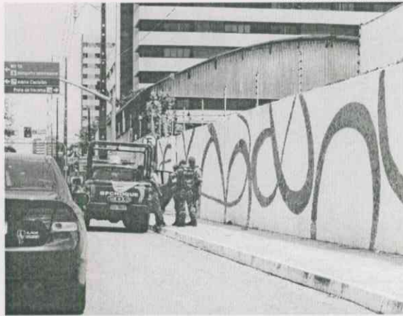
Para a socióloga Marília Monteiro, uma atuação mais estratégica é imprescindível para reduzir os índices de criminalidade

Além dos homicídios dolosos, os CVLIs também podem ser configurados como