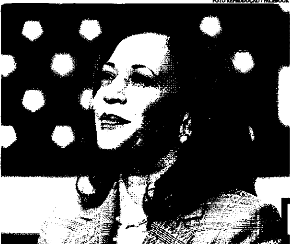
Kamala Harris é a aposta dos Democratas nas eleições deste ano

Mais de 200 criadores de conteúdo foram credenciados para cobrir a convenção do Partido Democrata nos Estados Unidos, que começa nesta segunda-feira (19) em Chicago. Os influenciadores terão acesso semelhante ao de jornalistas e uma plataforma exclusiva na pista do evento. É a primeira vez que o partido abre espaço para esses profissionais. Republicanos fizeram movimento semelhante em sua convenção no mês passado, mas em menor número: foram cerca de 70 credenciados.