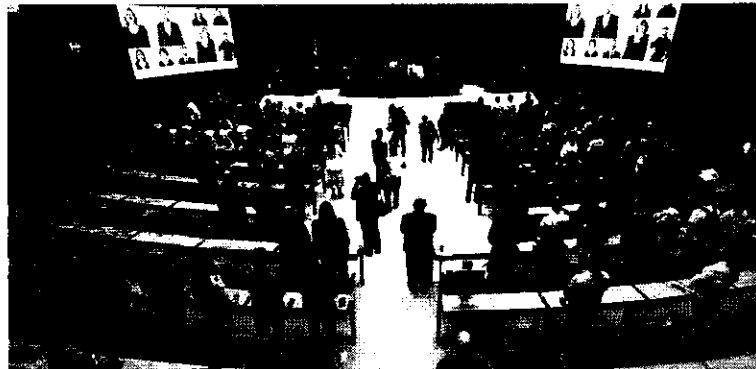
A comissão que vai analisar a proposta teria sido instalada ontem na Câmara, mas foi adiada

O texto, analisado na Câmara, tenta conceder o maior perdão da história aos partidos, com suspensão de multas por desrespeito à lei eleitoral