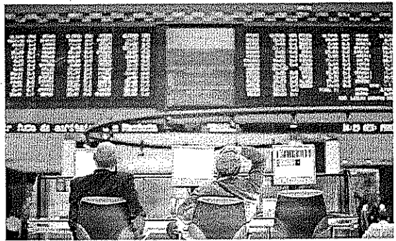
Para 2024, o mercado elevou a projeção de inflação para 3,09%, ante os 3,04% projetados na semana passada

norte-americana, a expectativa do mercado para a cotação do dólar em 2022 caiu novamente, ficando em R$ 5,50, frente os R$ 5,58 da semana passada. Para 2023, no entanto, a previsão apontada pelo mercado também diminuiu, passando de R$ 5,45 para R$ 5,36, e, para 2024, a estimativa para a cotação da moeda americana diminuiu ligeiramente pela terceira semana seguida, passando dos R$ 5,32 projetados na semana passada, para R$ 5,30.