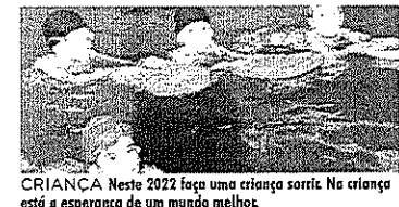
CRIANÇA Neste 2022 faça uma criança sorrir. No criança está a esperança de um mundo melhor.