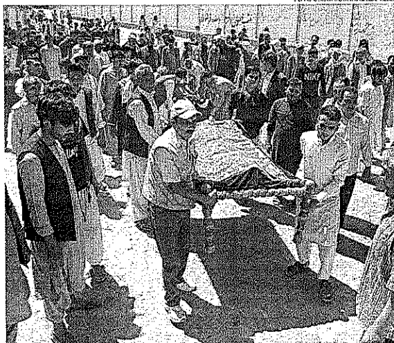
O ataque ocorreu enquanto cerca de mil civis esperavam no aeroporto para serem retirados

O presidente dos EUA, Joe Biden, disse que cumprirá o prazo para retirar todas as tropas dos EUA do Afeganistão até terça-feira. Uma autoridade dos EUA disse à Reuters no sábado que menos de 4 mil soldados permaneceram no aeroporto. Os Estados Unidos e seus aliados retiraram cerca de 114.400 pessoas — estrangeiros e afegãos vulneráveis — do país nas últimas duas semanas.