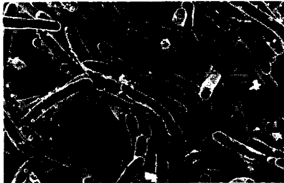
Os fortalezenses podem realizar o exame para detecção da tuberculose gratuitamente nos postos de saúde