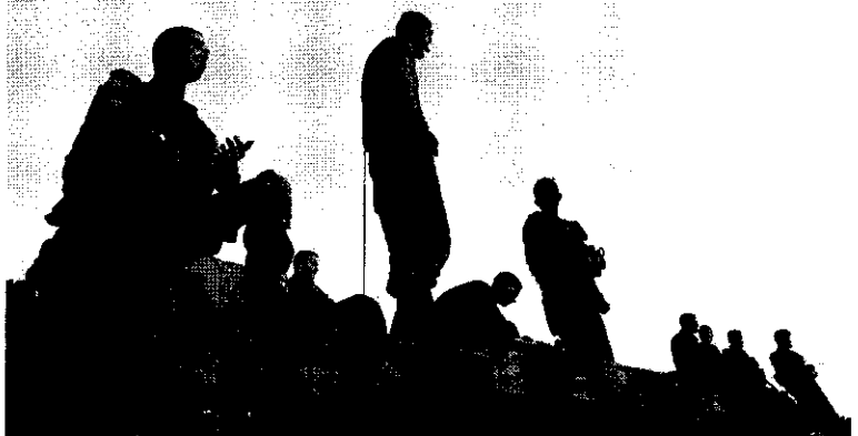
Soldados israelenses em veículo blindado de transporte de pessoal, perto da fronteira israel-Gaza, no sul de Israel

O Ministério das Finanças de Israel projetou que a guerra em Gaza se estenda até fevereiro de 2024, o cálculo de tempo leva em consideração as despesas