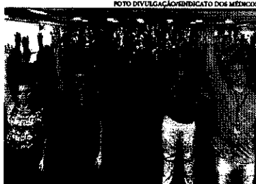
Os profissionais da saúde afirmaram que tentaram negociar com a Prefeitura, porém, sem sucesso

A pesar de já ter sido aprovado, o movimento só deve iniciar em meados da próxima semana e envolverá médicos, enfermeiros e dentistas