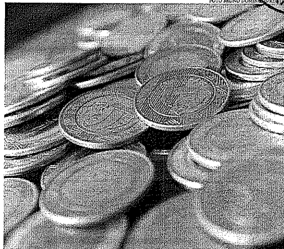
Arrecadação do IOF aumentou R$ 945 milhões, 26,28% acima da inflação em fevereiro desta ano, ao comparar com o mesmo mês de 2021

A arrecadação do governo federal registrou recorde no mês de fevereiro com crescimento de 5,27%, puxada pela recuperação da economia e pelo aumento do petróleo internacional. Os dados são da Receita Federal e foram divulgados nessa segunda-feira (28/03). No somatório geral, o governo arrecadou R$ 148,66 bilhões no mês passado. O valor é o maior da história para meses de fevereiro desde o início da série histórica da Receita Federal, em 1995, em valores corrigidos pela inflação. Em janeiro e fevereiro, a arrecadação federal soma R$ 383,99 bilhões, com alta de 12,92% acima da inflação pelo IPCA, também recorde para o período.