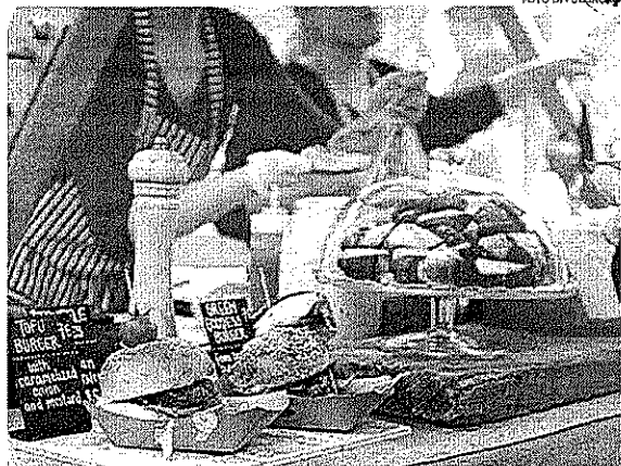
Nos últimos 12 meses, 8% dos entrevistados fizeram alimentos em casa para vender

Policiais sem reajustes. O presidente Bolsonaro (PL) vetou ontem (10) a proposta de reajuste especial para carreiras de policiais federais, civis e servidores da Abin (Agência Brasileira de Inteligência). Bolsonaro rejeitou os trechos da LDO que autorizavam reestruturação e recomposição salarial dessas carreiras.