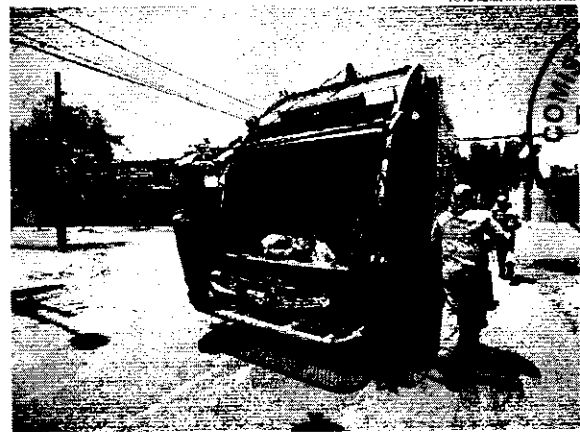
Atualmente, a coleta domiciliar ocorre três vezes por semana na capital cearense

A Prefeitura de Fortaleza lançou, nesta quinta-feira, 09, uma mobilização envolvendo ações de educação, fiscalização e limpeza urbana para promover a criação de uma capital mais sustentável. "Uma cidade mais limpa é uma cidade mais saudável, onde a família vive melhor. Vamos engajar toda a cidade nesse compromisso que é de todos nós, do Poder Público, da iniciativa privada e dos cidadãos e cidadãs. Será uma ação conjunta, que inclui os caminhões de coleta de recicláveis, o videomonitoramento, a ampliação do número de ecopontos, de baúros atendidos pelo Reciclo, de agentes de limpeza. Teremos um grande time de dez mil pessoas trabalhando para fazer de Fortaleza a cidade mais limpa do Brasil", explicou o prefeito José Sarto.