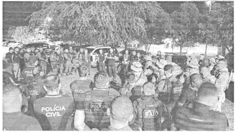
Operação está na sua terceira fase e trabalhos devem continuar, afirma a Secretaria de Segurança Pública e Defesa Social (SSPDS)

Balanco foi divulgado junto aos resultados da terceira fase de operação que teve prisões focadas em Caridade