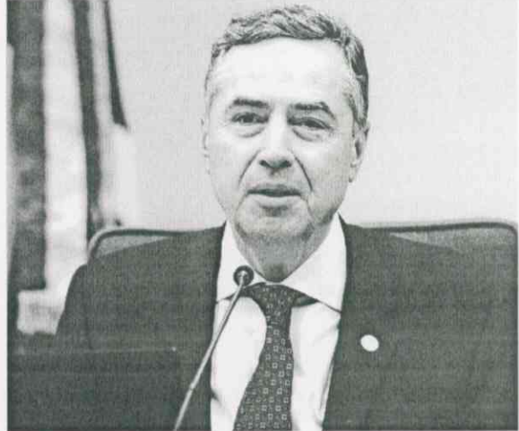
Luís Roberto Barroso, presidente do TSE, foi convidado para discutir a legislação eleitoral

Acontece hoje reunião da Comissão de Constituição e Justiça (CCJ) para votar a indicação de ministros para o Superior Tribunal Militar (STM) e para o Tribunal Superior do Trabalho (TST). A Comissão de Assuntos Econômicos (CAE) também se reúne na segunda. Na pauta, indicados para as diretorias