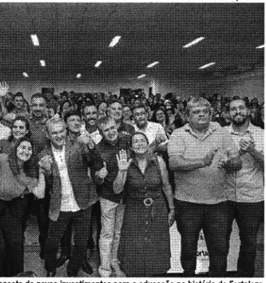
Sarto informou que este é o maior pacote de novos investimentos para a educação na história de Fortaleza

Durante o anúncio, a Prefeitura informou que, desde o in-